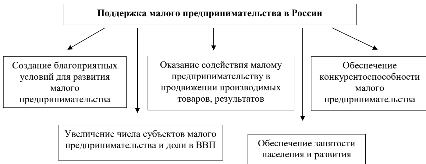
Рис. 2. Поддержка малого предпринимательства в России

Сектор малого бизнеса способен создавать новые рабочие места и, следовательно, может снизить безработицу и социальную напряженность в стране. Малое предпринимательство ведет к оздоровлению экономики в целом и, следовательно, лучший выход для России - это создание такой политики государства, которая была бы направлена на расширение и развитие предприятий малого предпринимательства в нашей стране.