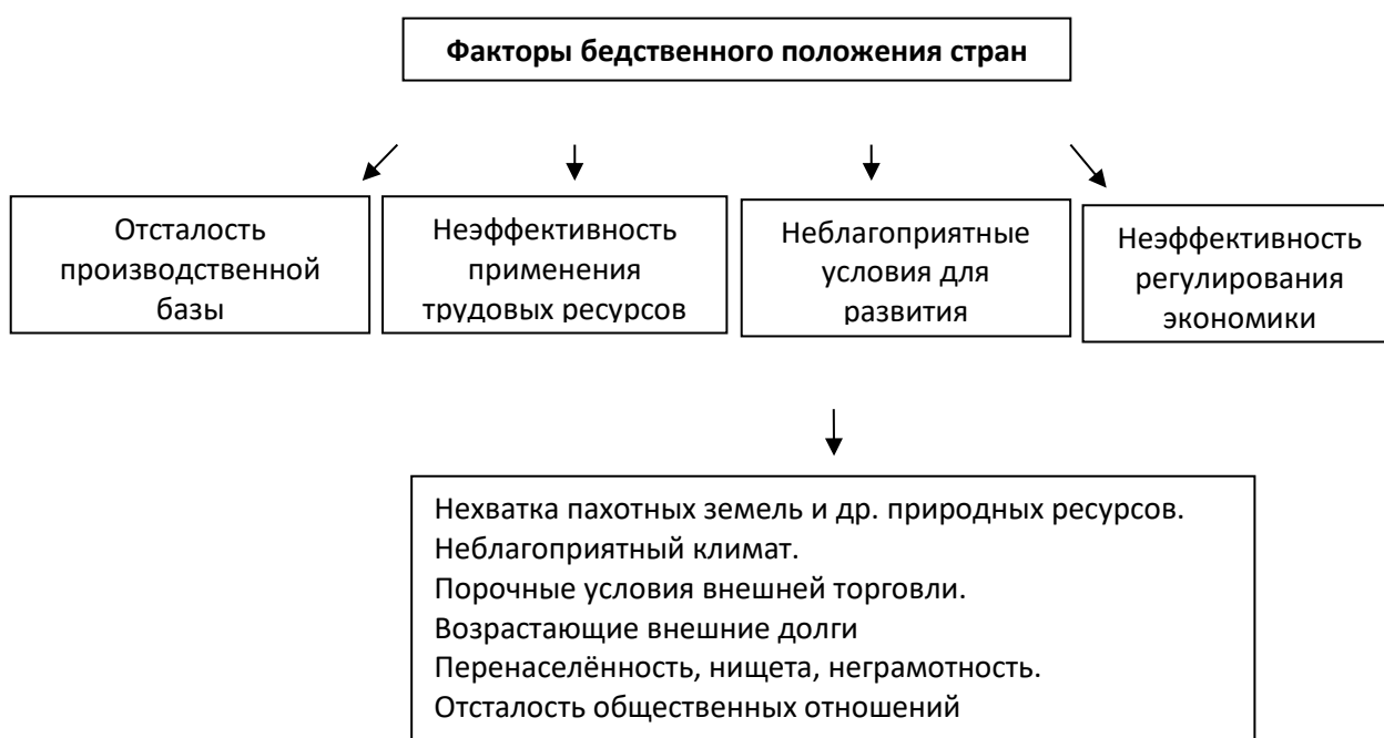
Рисунок 2 Факторы бедственного положения стран

Главные факторы бедственного положения стран можно свести к четырем взаимосвязанным позициям, представленным на рисунке 2.